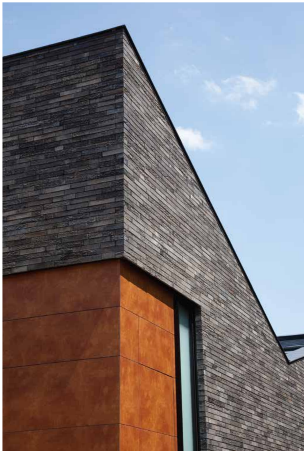
Blanco Architecten, Hoeilaart