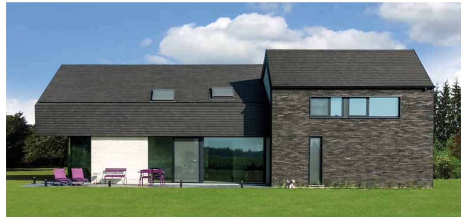
Gevel: Marono Gesmoord / Dak: Koramic Tegelpan Plato Blauw gesmoord