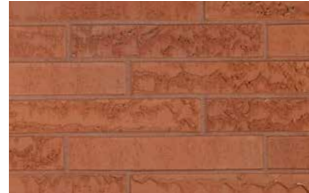
Marono Rood Formaat ± 288x90x48 mm