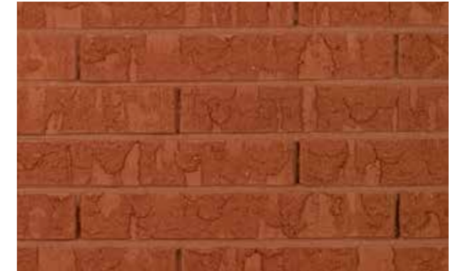
Marono Rood Extra Formaat ± 288x90x48 mm