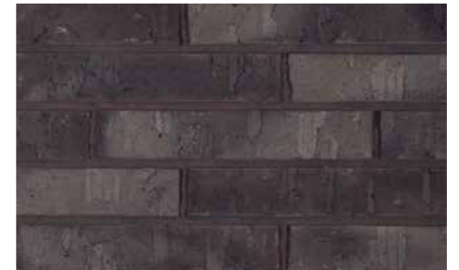
Marono Gesmoord Extra Formaat ± 288x90x48 mm