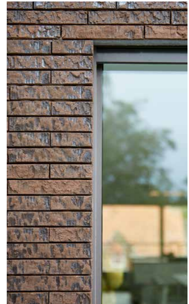
Marono Bruin Extra E1