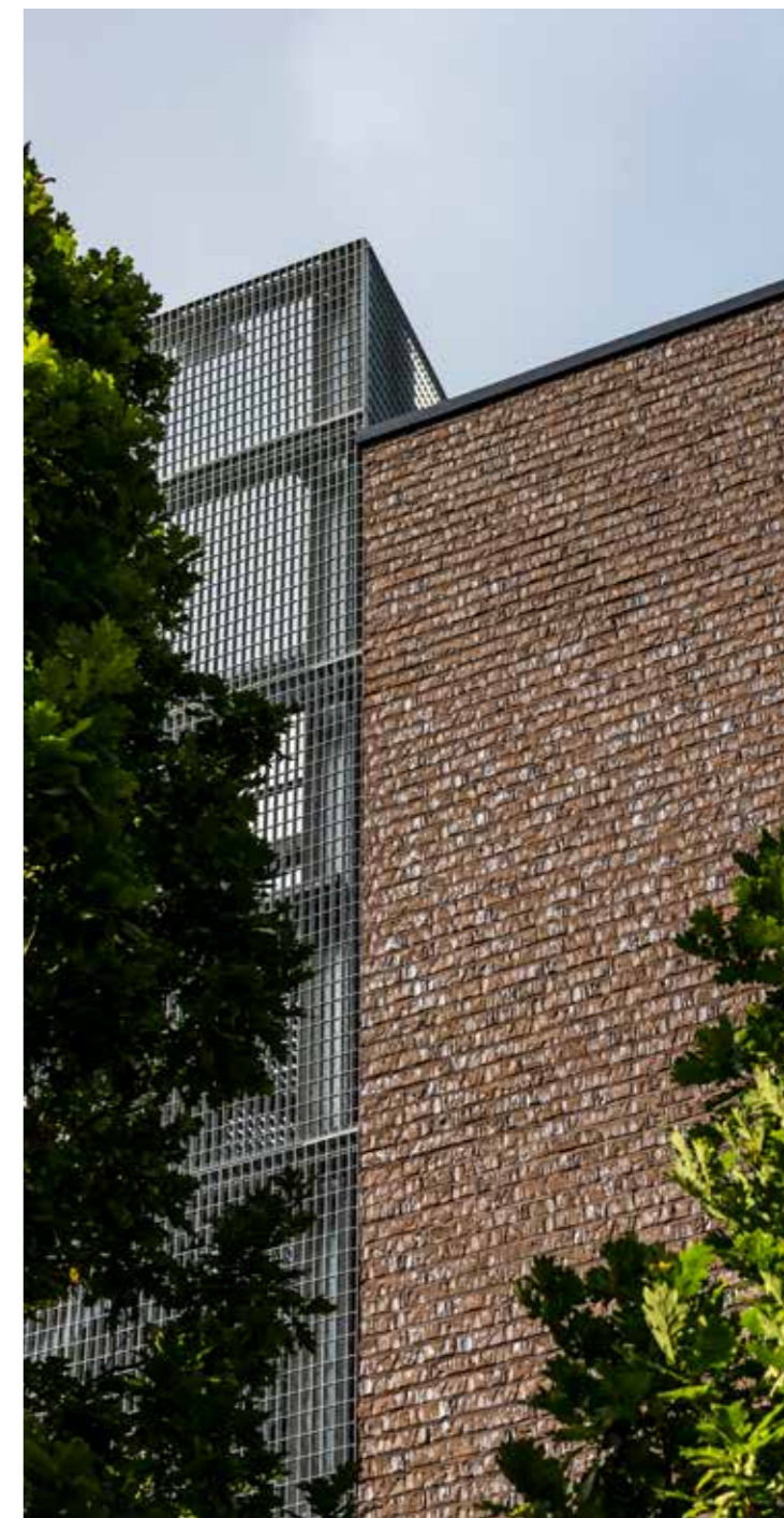
Marono Bruin Extra E1