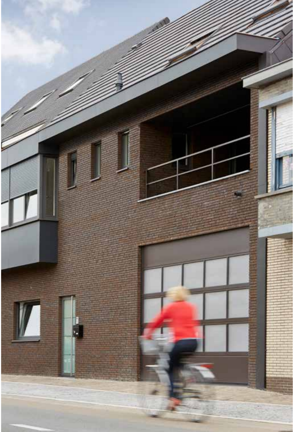
Marono Bruin Extra E1