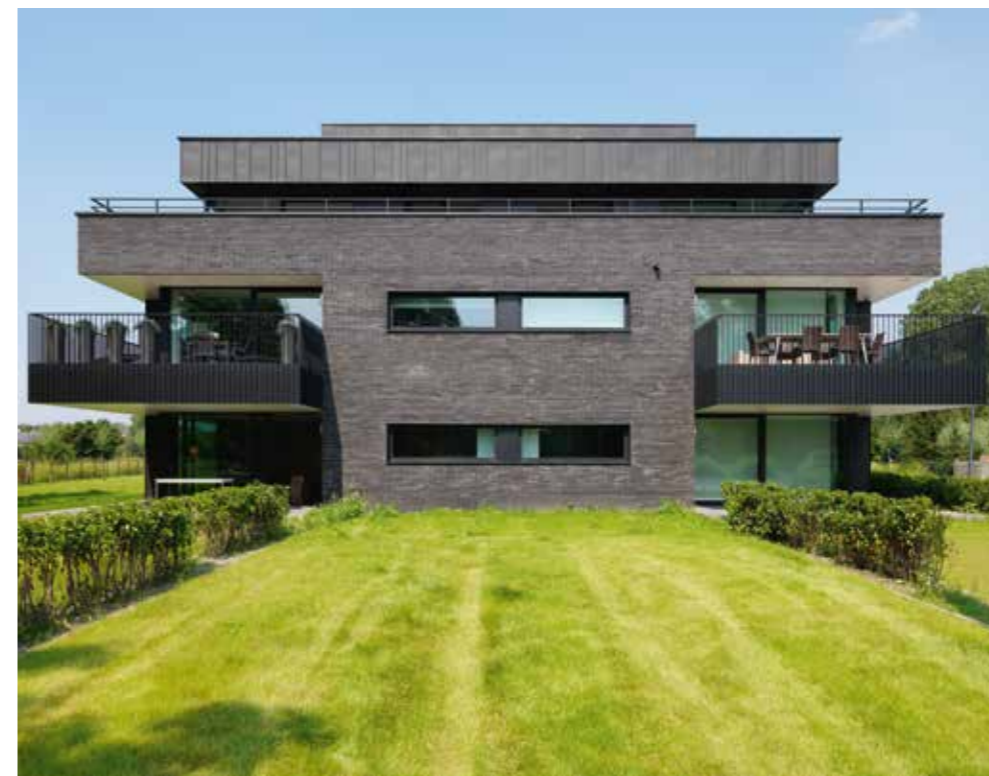
Marono Gesmoord Extra

“Voor architecten op zoek naar mooie, lange lijnen door een extra lang formaat”