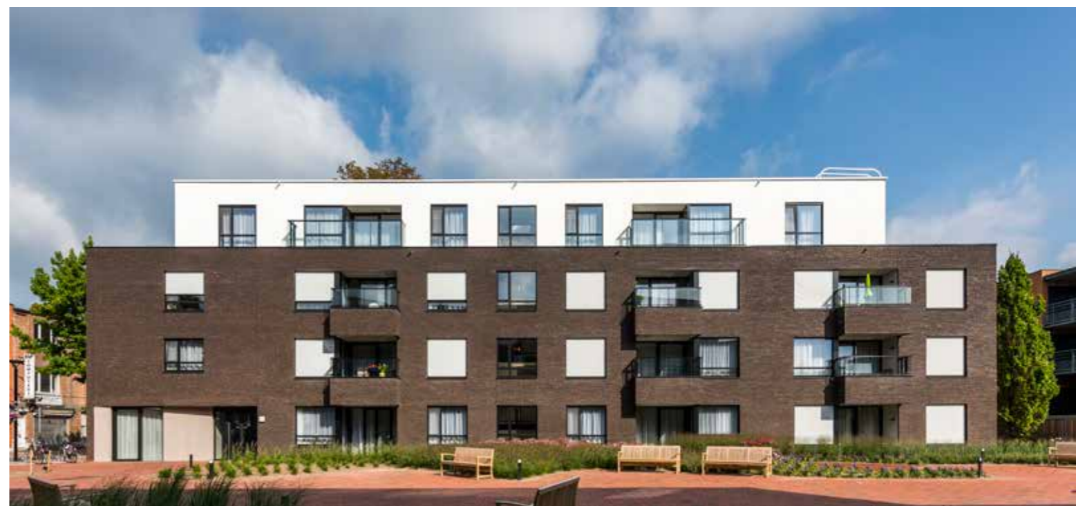
abv+ architecten, Antwerpen