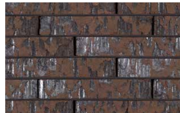
Marono Bruin Extra E1 Formaat ± 288x90x48 mm