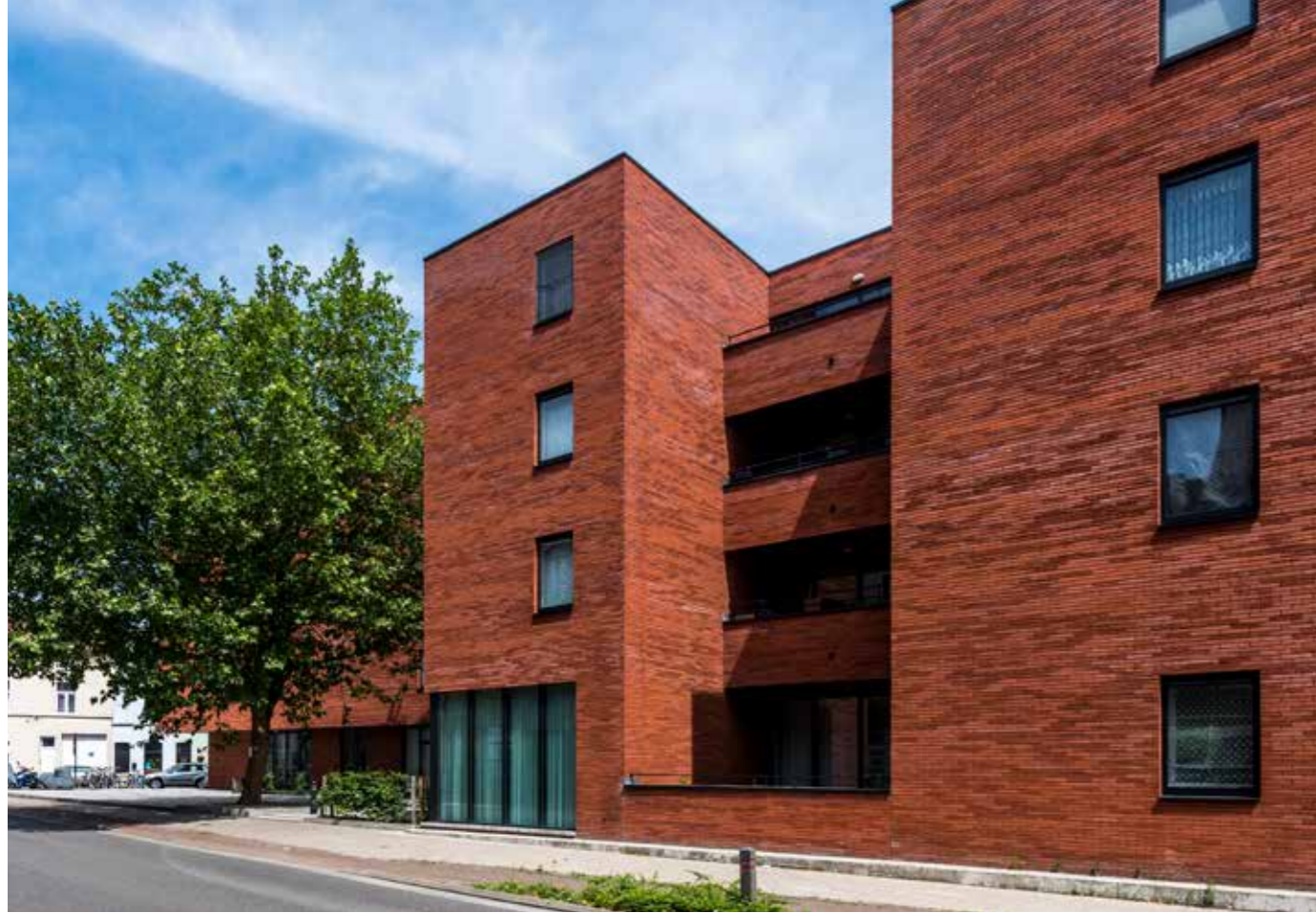
Marono Rood Extra