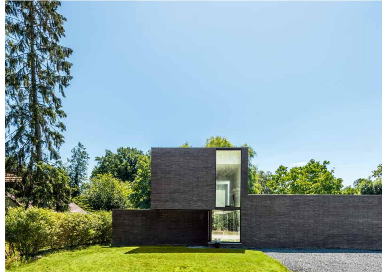
Marono Gesmoord Extra