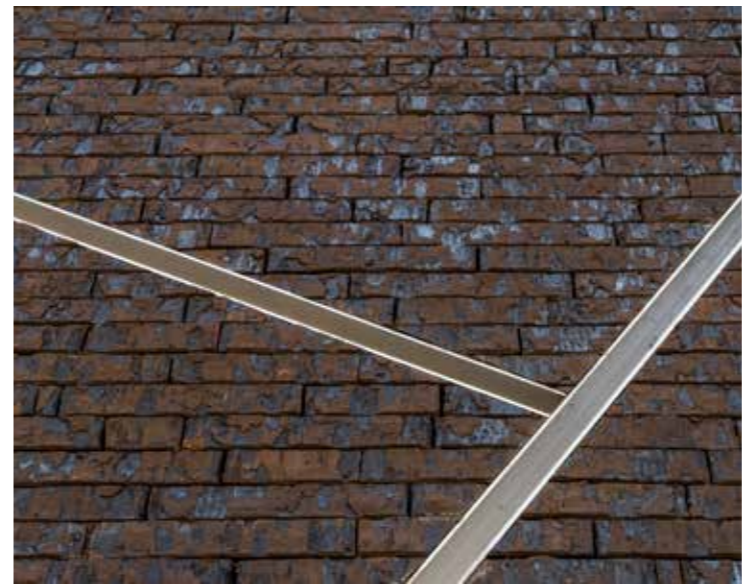
Architectuur Van Ryckeghem, Willebroek