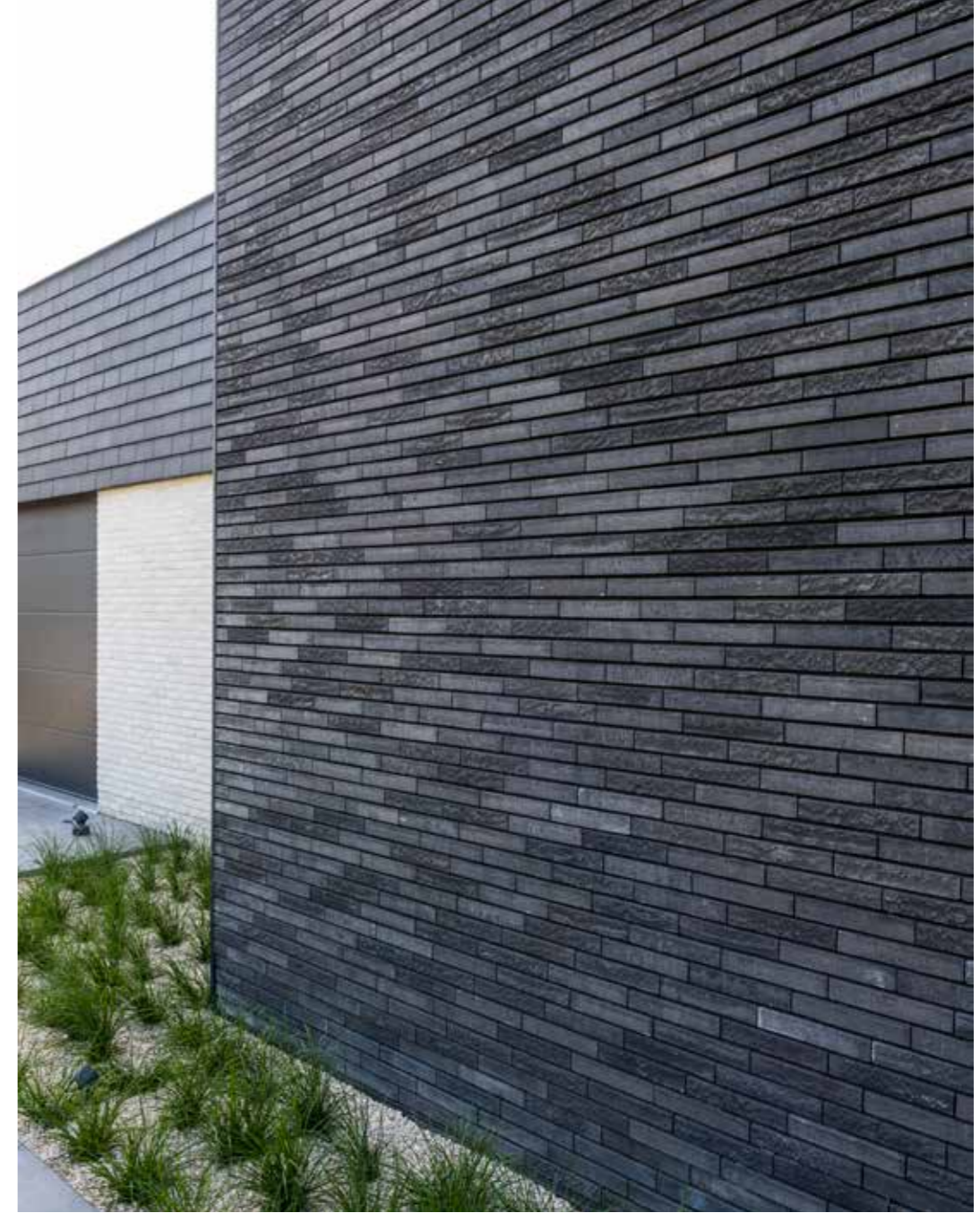
Group O-Architecten, Gent