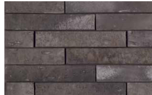
Marono Gesmoord Formaat ± 288x90x48 mm