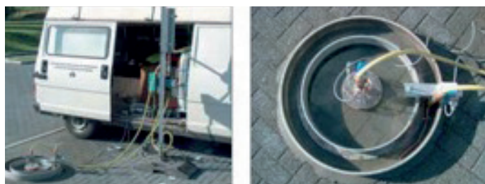
Essai au double anneau (CRR, 2008)

La perméabilité sera contrôlée au moyen d'un essai au double anneau (Illustration 6). Deux anneaux sont posés sur le revêtement, puis de l'eau est versée dans chacun des deux anneaux. L'eau située dans l'anneau extérieur fait en sorte que l'eau du cercle intérieur s'écoule aussi verticalement que possible. La mesure proprement dite s'effectue dans l'anneau intérieur, dont le niveau d'eau est maintenu constant. Le débit permet donc de mesurer la perméabilité; ces mesures sont réalisées pendant 20 minutes.