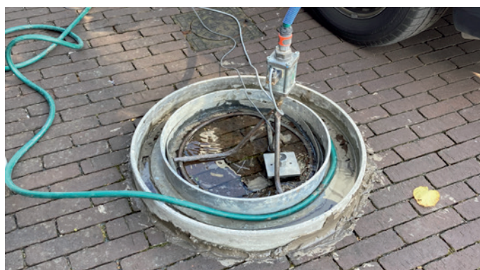
Essai au double anneau au point de mesure 2, juillet 2022

Ces résultats montrent que, 8 ans après l'aménagement du parking, le coefficient de perméabilité aux points de mesure est encore et toujours supérieur à l'exigence minimale de 5,4 \cdot 10^{-5} \text{m/s} . Cela garantit le fonctionnement du système et la perméabilité à l'eau vers le sous-sol.