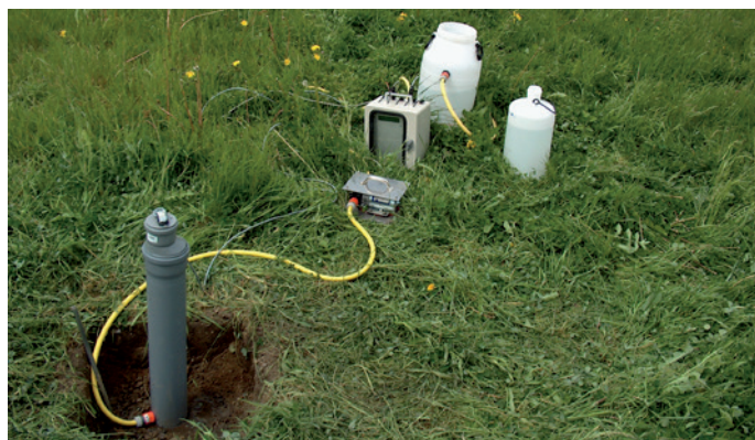
Essai open-end (CRR, 2008)

Il sera cependant préférable de déterminer celle-ci sur place; cela pourra se faire par exemple au moyen d'un essai 'open-end', pour lequel une colonne d'eau est disposée sur le sol à une hauteur constante de 1 m. Une mesure continue de l'eau ajoutée pendant au moins 20 minutes permet de déterminer la perméabilité du sol (CRR, 2008).